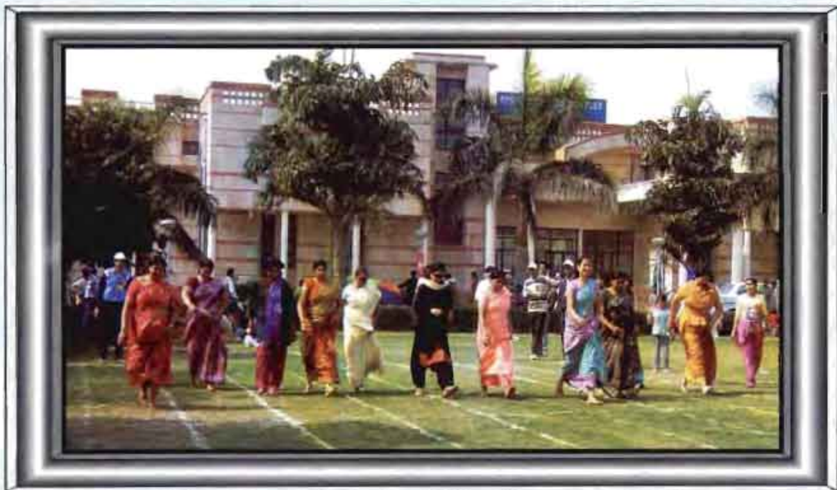
A view of Annual Sports day of PDIL celebrated on 13.2.2011 with active participation of family members of employees.

PDIL recognizes that the efforts of each and every member of the PDIL family is essential for development of the company. Recognizing the need for harmony among employees and their involvement, PDIL celebrated its Annual Sports Day on 13.2.2011. Employees along with their family members assembled together to celebrate the occasion. Sports & Cultural activities were organized. Right to information system is in place in the organization. Citizen Charter is in place in PDIL where general public can have information about the company and can redress the grievances.