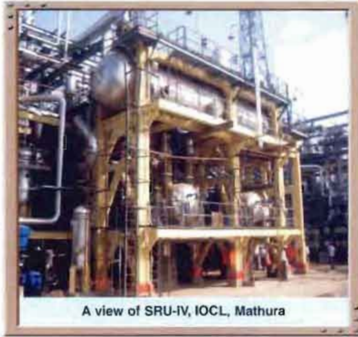
A view of SRU-IV, IOCL, Mathura

Your company has established its credentials for Third Party Inspection (TPI) and Non Destructive Testing (NDT) Services, Statutory inspection, testing and certification of Horton Spheres, Mounded LPG Bullets. Inspection and recommissioning of Ammonia Storage Tanks etc. continued to be a specialized activity of PDIL.