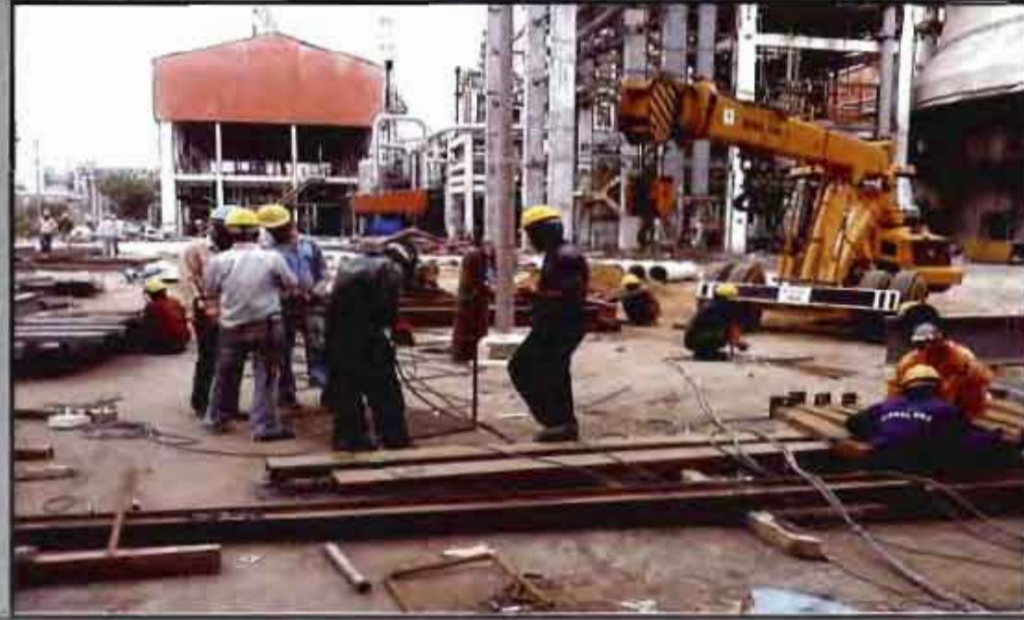
A view of Ammonia & Urea Plant revamp, KIRBHCO, Hazira.

आधारित मेथानेशन उत्प्रेरक और मैसर्स जॉनसन-कानपुर को सुपर मेथानेशन उत्प्रेरक, कृष्णको-हजीरा एवं एनएफसीएल-काकीनाडा को एचटी शिफ्ट उत्प्रेरक सेल-राउरकेला, सेल-भिलाई, कृष्णा इंडस्ट्रिज-चेन्नई एवं कीर्ति प्राइवेट लिमिटेड-बंगलौर को वैनाडियम पेंटोक्साइड उत्प्रेरक को आपूर्ति के लिए प्रतिष्ठित आर्डर का संपादन किया।