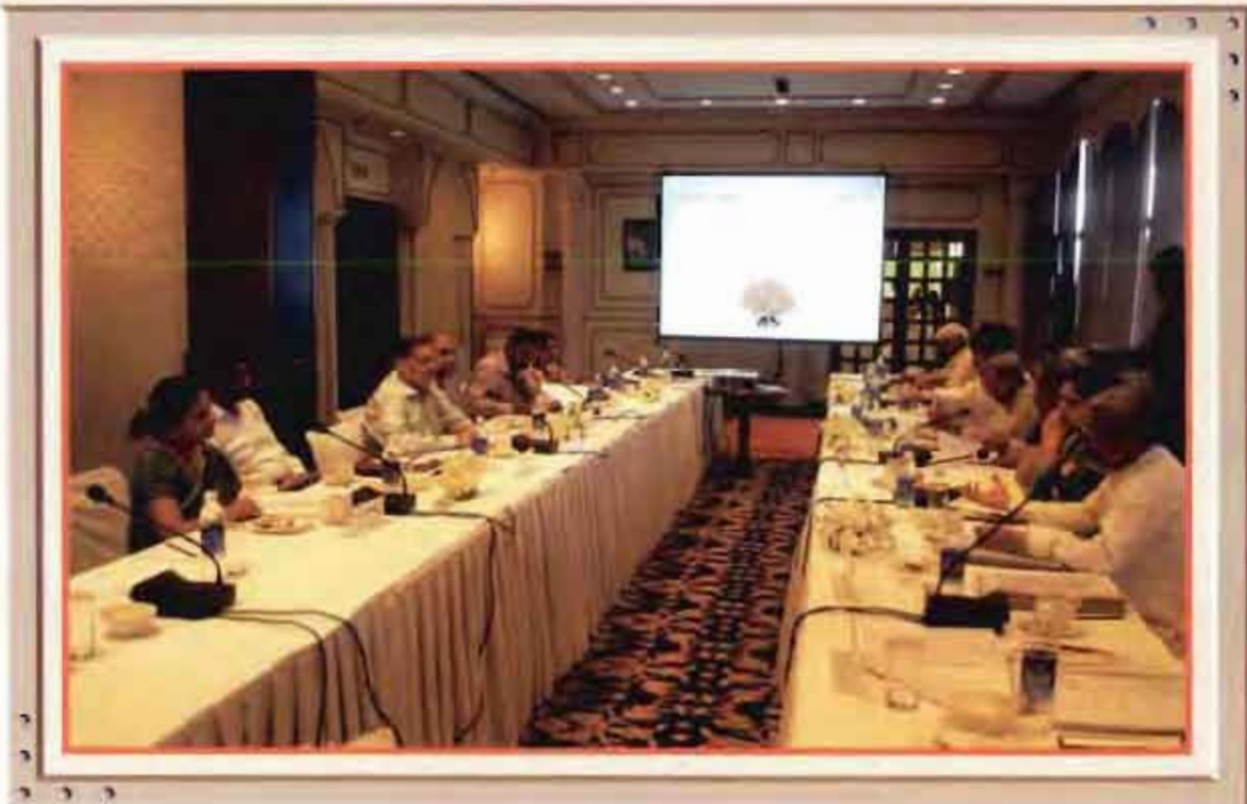
Review of Hindi Implementation of Noida office by Parliamentary sub Committee on Official Language

Your Company continued its intensive efforts to propagate and implement various provisions of Official Language Policy of the Government of India. For promoting the use of Hindi, in all the Departments, Hindi software has been loaded to facilitate Hindi typing. Every day a Hindi Suvichar and a translation of Hindi word are being e-mailed to all the employees on their computers. Many interesting programmes like Antakshari, Extempore speech Competition and Hindi quizzes are organized regularly. Hindi Pakhwara' was organized during 14 th September 2010 to 30 th September 2010. First sub committee of the Committee of Parliament on Official Language inspected Chennai office on 31.12.2010.