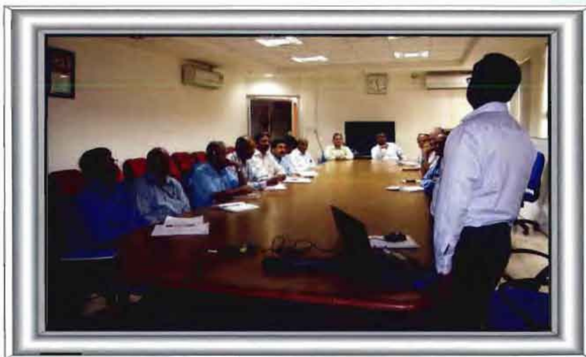
A view of Vigilance Awareness week with active participation of employees

'Vigilance Awareness Week' was observed from 25 th October to 5 th November, 2010, with active participation of the employees at various levels.