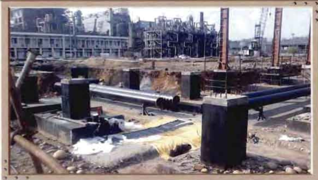
A view of Ammonia Plant Feedstock change over project, NFL, Nangal

परामर्शी सेवाओं तथा मैसर्स मैट्रिक्स फर्टिलाइजर्स एंड केमिकल्स लिमिटेड के लिए पानागढ़ पश्चिम बंगाल में यूरिया प्रहस्तन एवं हस्तगत प्रणाली के लिए अभियांत्रिकी परामर्शी सेवाओं के लिए, आर्डर प्राप्त करने में भी सफल हुई थी।