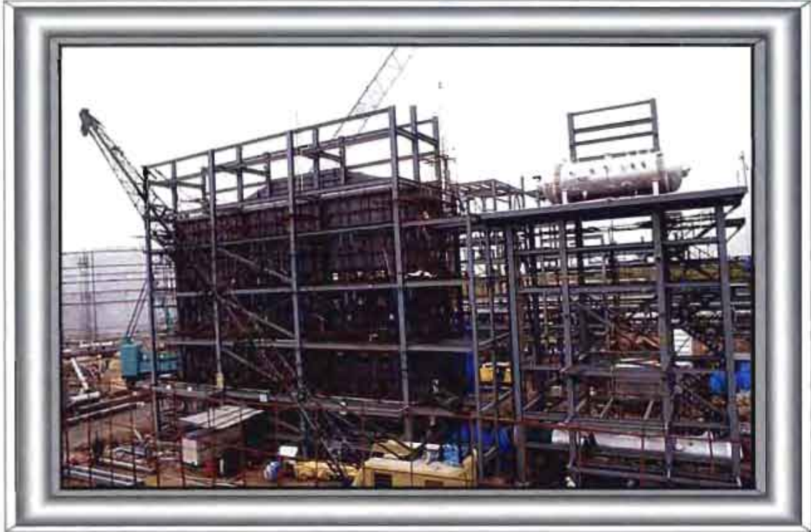
A view of Hydrogen Generation Unit, Chennai Petroleum Corporation Limited, Chennai