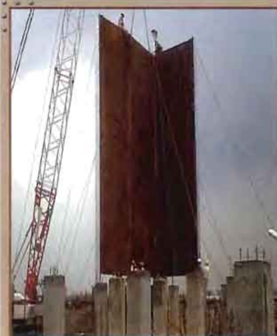
View of Ammonia plant execution site of Matix Fertilizer, Panagarh, West Bengal

orders for Detailed Engineering Consultancy services for Urea Revamp Project at Thal for M/s Rashtriya Chemicals & Fertilizers Ltd and Engineering Consultancy services for Urea Handling and Bagging system at Panagarh, West Bengal for M/s Matix Fertilizers & Chemicals Ltd.