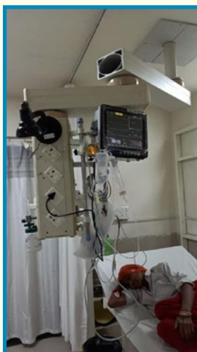
Monitors installed at GIMs under CSR