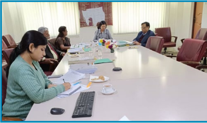
Board Meeting of PDIL at Board Room, PDIL Bhawan