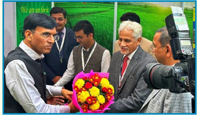
PDIL at FAI Seminar