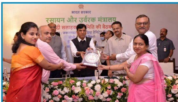
PDIL was awarded Third Prize for its outstanding contribution toward implementation of Hindi language (FY 2022-23)

In recognition of the Company's outstanding efforts in the area, PDIL was awarded with Third Prize for its outstanding, appreciable and motivational contribution towards the Implementation of Official Language-Hindi during the financial year 2022-23. Union Minister of Chemical & Fertilizers and Health & Welfare, Dr. Mansukh Mandaviya, bestowed this award to your Company during Hindi Salahkar Samiti Meeting of Ministry of Chemicals & Fertilizers.