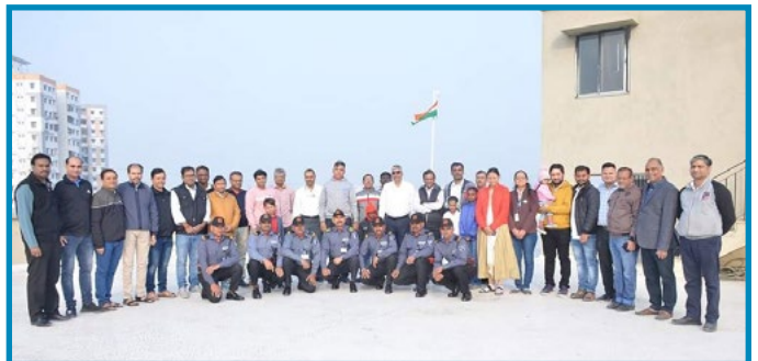
Republic day Celebration at PDIL, Vadodra

The Website provides information on various matters related to PDIL like Services Offered, Projects Executed/being Executed, Board of Directors, Key Executives, Job Vacancies, Tenders Notices, Vendor Registration, RTI etc. Your Company also kept abreast with ever changing trend of use of social media with PDIL launching its Twitter handle and Facebook page. The latest happenings, achievement, celebrations are regularly posted over Twitter and Facebook.