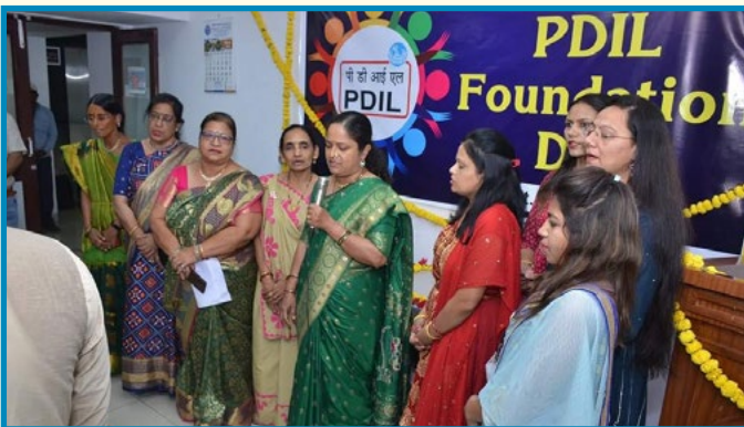
Celebration of PDIL's Foundation Day at Vadodara Unit