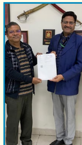
MOU signing 2022-23 CSR at GIMS