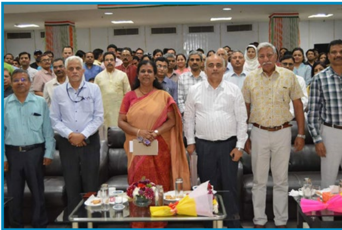
Foundation Day Celebration at PDIL, Noida

आपकी कंपनी अच्छे जनसंपर्क बनाए रखने के महत्व को पहचानती है। पीडीआईएल ने फर्टिलाइजर एसोसिएशन ऑफ इंडिया (एफएआई) के सेमिनार में भाग लिया। आपकी कंपनी ने पीडीआईएल में गणतंत्र दिवस, योग दिवस, स्वतंत्रता दिवस, राजभाषा पखवाड़ा, संविधान दिवस, सतर्कता जागरूकता सप्ताह उत्पादकता सप्ताह आदि जैसे महत्वपूर्ण घटनाओं/मामलों पर मीडिया/सोशल मीडिया समाचार जारी किए। आपकी कंपनी ने समय-समय पर अपनी वेबसाइट अपडेट की। यह संभावित ग्राहकों और आम जनता के साथ एक इंटरफेस है।