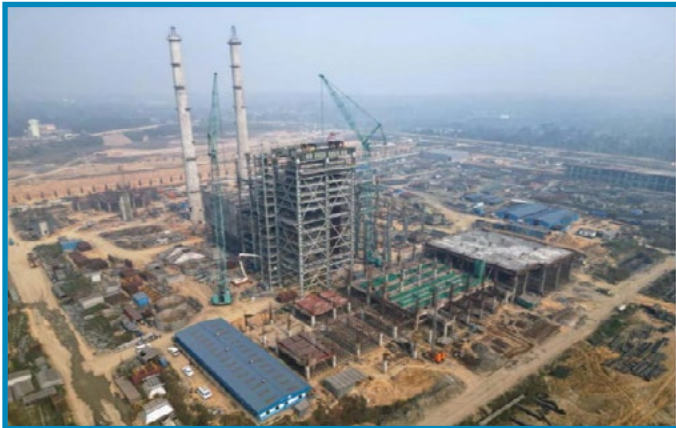
Steam Generation Plant