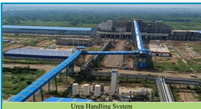
Urea Handling System