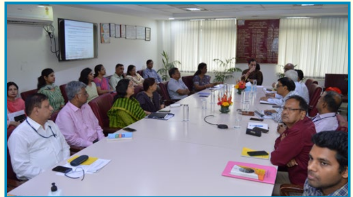
Hon'ble Minister of State (Chemicals & Fertilizers)- Shri Bhagwanth Khuba ji visited PDIL Noida.