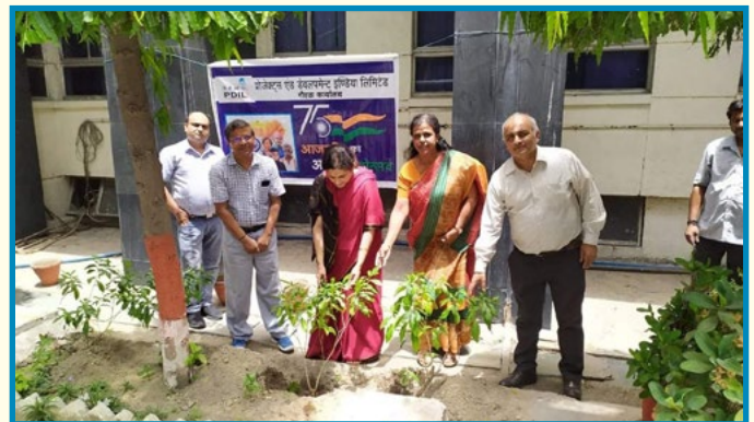
Plantation Drive with participation of CMD & DF, PDIL commemorating Azadi Ka Amrit Mahotsav