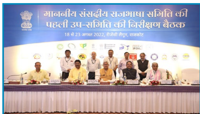
Inspection of PDIL, Vadodara Office by Parliamentary Committee on official language

इस क्षेत्र में कंपनी के उत्कृष्ट प्रयासों की मान्यता के रूप में, पीडीआईएल को वित्तीय वर्ष 2022-23 के दौरान राजभाषा-हिंदी के कार्यान्वयन में उत्कृष्ट, सराहनीय और प्रेरक योगदान के लिए तीसरे पुरस्कार से सम्मानित किया गया। केंद्रीय रसायन एवं उर्वरक तथा स्वास्थ्य एवं कल्याण मंत्री डॉ. मनसुख मंडाविया ने रसायन एवं उर्वरक मंत्रालय की हिंदी सलाहकार समिति की बैठक के दौरान आपकी कंपनी को यह पुरस्कार प्रदान किया।