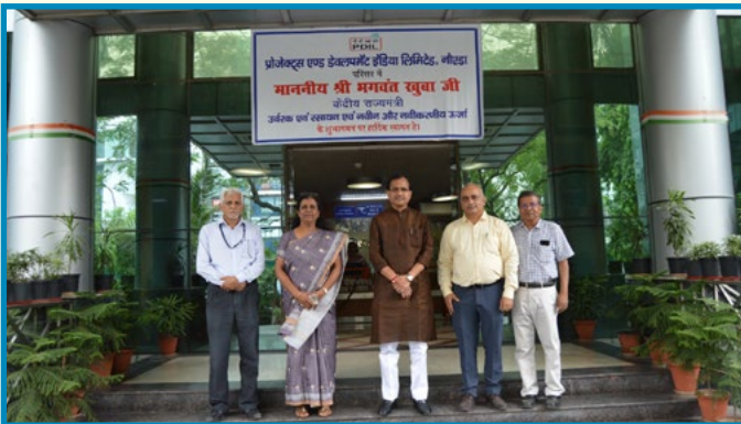
Hon'ble Minister of State (Chemicals & Fertilizers)- Shri Bhagwanth Khuba ji visited PDIL Noida