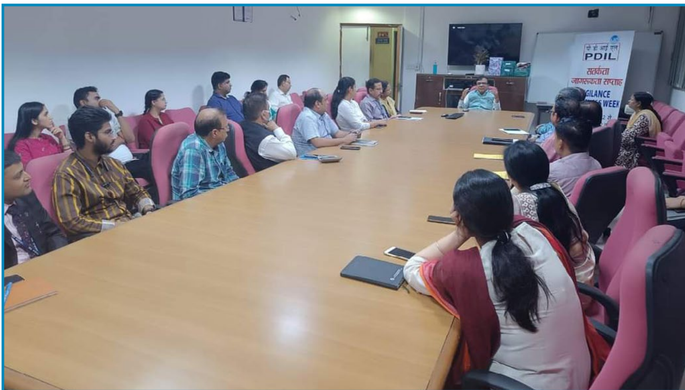
Vigilance Awareness Week celebration at PDIL Noida

कंपनी में सतर्कता का जोर विभिन्न विभागों के कामकाज में अधिक पारदर्शिता, अखंडता और दक्षता लाना है। इस उद्देश्य को प्राप्त करने के लिए नियमित निरीक्षण, संपत्ति रिटर्न की जांच और अन्य उपयुक्त उपायों के माध्यम से विभिन्न गतिविधियों पर सावधानीपूर्वक नजर रखी जाती है। सतर्कता विभाग प्रणाली में सुधार पर ध्यान केंद्रित करता है और जहां भी आवश्यक हो उचित सुधारात्मक कार्रवाई की जाती है।