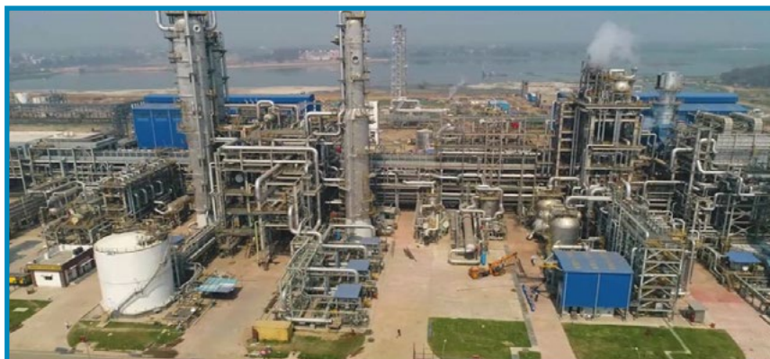
Methanation & Shift Conversion Section, HURL Gorakhpur