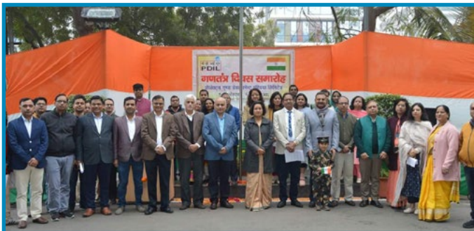
Republic Day Celebration at PDIL, Noida

वेबसाइट पीडीआईएल से संबंधित विभिन्न मामलों जैसे कि दी गई सेवाएं, निष्पादित/निष्पादित की जा रही परियोजनाएं, निदेशक मंडल, प्रमुख कार्यकारी अधिकारी, नौकरी रिक्तियां, निविदाएं नोटिस, विक्रेता पंजीकरण, आरटीआई आदि पर जानकारी प्रदान करती है। आपकी कंपनी ने भी सोशल मीडिया के उपयोग की बदलती प्रवृत्ति के साथ पीडीआईएल हेतु अपना ट्विटर हैंडल और फेसबुक पेज लॉन्च किया है। नवीनतम घटनाओं, उपलब्धियों, समारोहों को नियमित रूप से ट्विटर और फेसबुक पर पोस्ट किया जाता है।