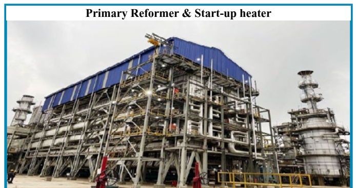
Primary Reformer & Start-up heater